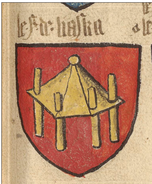
1. Herb Laska w Herbarzu Złotego Runa ( Le grand armorial de la Toison d'Or , Bibliothèque de l'Arsenal Paris, Ms. 4790, k. 120r, dostępny online: < http://gallica.bnf.fr/ark:/12148/btv1b55009806h > [dostęp: 10 sierpnia 2019])