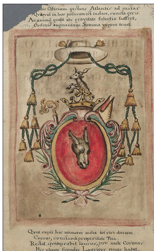
2. Odwrocie strony tytułowej inwentarza z 1746 r. (BDS, Akta Zgromadzenia oo. Benedyktynów w Sieciechowie, sygn. R. 1930, k. 103)

okresu średniowiecza. Na niespełna 50 dokumentów pergaminowych proveniencji sieciechowskiej, przechowywanych dzisiaj w zasobie Archiwum Głównego Akt Dawnych w Warszawie, próbę czasu przetrwały zaledwie dwa klasztorne odciski pieczętnie dołączone do jednego dokumentu. Podobnie rzecz ma się, gdy spojrzymy na akta klasztoru przechowywane w zbiorach innych instytucji archiwalnych i bibliotecznych. Najstarsze egzemplarze klasztornych pieczęci sieciechowskich zachowały się w Archiwum Klarysek Krakowskich oraz w Archiwum Polskiej Prowincji Dominikanów. Sigilla sieciechowskie niewątpliwie wymagają dalszych badań inwentaryzacyjnych i proveniencyjnych, zwłaszcza prowadzonych na podstawie zbiorów pieczęci luźnych i tłoków pieczętnych. Odnalezione nowe egzemplarze, wobec strat poniesionych w zasobie przez archiwum klasztorne, nie zmieniają jednak w znaczący sposób obrazu zachowanego materiału źródłowego. Wyjściem z tej sytuacji pozostają studia o charakterze porównawczym, z wykorzystaniem dorobku badawczego nad sfragistyką zakonną, który w ostatnich latach został istotnie powiększony 34 . Poniższe uwagi nie aspirują do pełnego omówienia problematyki pieczęci herbowych klasztoru sieciechowskiego, ale mają na celu uzupełnienie istniejącej luki badawczej i służą ożywieniu badań nad sfragistyką sieciechowską.