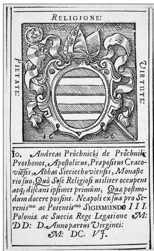
13. Ekslibris donacyjny Jana Andrzeja Próchnickiego dla biblioteki benedyktynów z Sieciechowa z 1606 r., (cyt. za: M. Gębarowicz, (1553–1633) mecenas i bibliofil. Szkic z dziejów kultury w epoce kontrreformacji , Kraków 1981, il. nr 5)

z dzieł opatrzonych znakiem opata zachowały się w zbiorach Biblioteki Uniwersytetu Warszawskiego 94 oraz Biblioteki Diecezjalnej w Sandomierzu 95 . Są one interesującym przykładem źródła badawczego o charakterze heraldycznym.