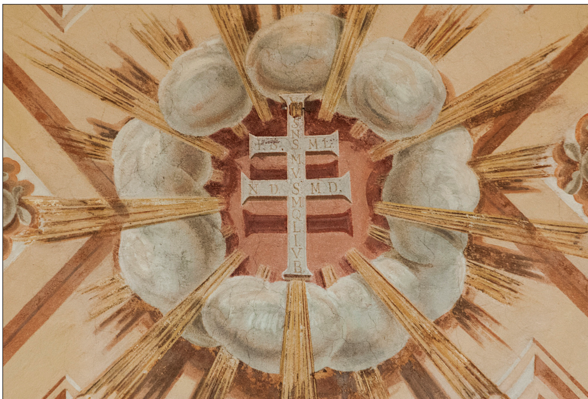
10. Krzyż patriarchalny na sklepieniu nawy głównej w kościele parafialnym pw. Wniebowzięcia NMP w Opactwie

Górze i co najmniej od połowy XV w. występował w polu pieczęci konwentu łysogórskiego 69 . Jest też najczęściej pojawiającym się znakiem w bogatej dekoracji heraldycznej wprowadzonej na wsporniki i zworniki sklepień krzyżowych w krużgankach klasztornych zespołu świętokrzyskiego 70 .