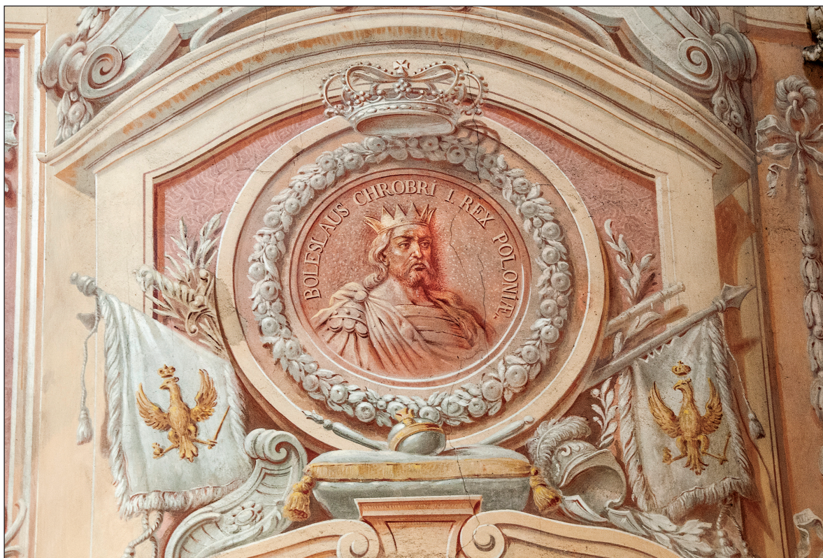
11. Medalion z podobizną króla Bolesława Chrobrego i znakiem Orła Białego, kościół parafialny pw. Wniebowzięcia NMP w Opactwie

się na sąsiedniej stronie dokumentu. Widać na niej tarczę z wycięciami po bokach, na której widoczny jest kontur wizerunku orła z umieszczonym na piersi znakiem topora. Stan zachowania opisanego wyobrażenia nie pozwala, niestety, na jego szerszą interpretację.