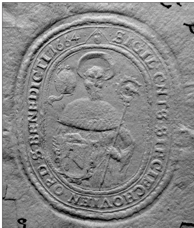
5. Pieczęć klasztorna odcisnięta przez papier, 1664 (BDS, AKKKS, rkps. sygn. 755, k. 47)

Na używanej od drugiej połowy XVII w. pieczęci owalnej konwentu sieciechowskiego św. Benedykt był przedstawiany jako postać stojąca, ubrana w strój zakonny, z głową otoczoną nimbem. W swojej lewej ręce święty trzyma pastorał, a w prawej tarczę ze znakiem klasztoru — toporem o ostrzu skierowanym w lewą stronę heraldyczną (il. 5) 42 . Na wysokości głowy świętego, po jej lewej stronie, umieszczono atrybut o trudnym do zidentyfikowania charakterze. Być może jest to przedstawienie infuły opackiej oraz zwisającej z niej wstęgi, ale bardziej przekonująco wydaje się interpretacja owego wyobrażenia jako pękniętego naczynia odwróconego do góry dnem, z którego wypływa wąż — jako nawiązanie do żywota św. Benedykta, który rozpoznał truciznę podaną mu w szklanej czarze z winem przez mnichów w Vicovaro 43 . Nad naczyniem umieszczono dwa krzyżyki mogące symbolizować znak krzyża, który zgodnie z tradycją św. Benedykt kreślił swą ręką w rozmaitych okolicznościach. Gdy więc w klasztorze w Vicovaro święty zasiadł do stołu, aby stosownie do zwyczaju pobłogosławić napój, po wyciągnięciu ręki i uczynieniu znaku krzyża, sprawił, że kubek z winem pękł, „zupełnie, tak jakby nie krzyż, lecz kamień spadł na to