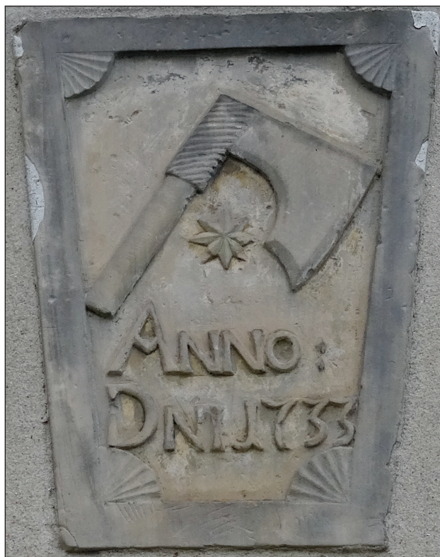
8. Płaskorzeźba z herbem klasztoru sieciechowskiego na budynku plebanii w Opactwie, fot. R. Stępień

ośmiopromienną złotą gwiazdę 58 . Złote słońce w czerwonym polu tarczy symbolizuje letniskowy charakter miejscowości, a topór w skos i ośmiopromienna gwiazda nawiązują do godła klasztoru sieciechowskiego umieszczonego na płaskorzeźbie z datą 1733 r. Znaczna część obszaru obecnej gminy wchodziła dawniej w skład dóbr ziemskich stanowiących własność benedyktynów sieciechowskich. Herb gminy stanowi interesujący przykład oddziaływania znaku klasztoru na symbolikę współczesnej heraldyki samorządowej.