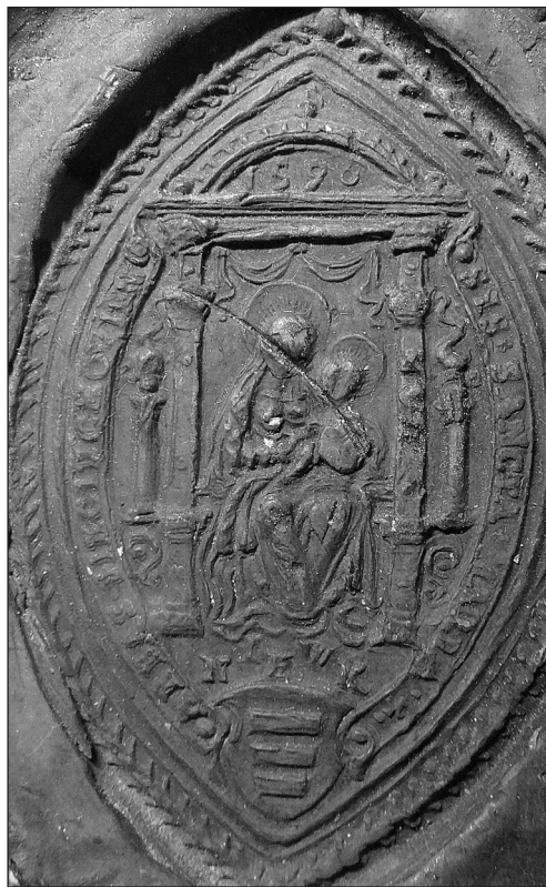
4. Pieczęć opata Józefa Wereszczyńskiego z 1590 r. (APPD, sygn. DokKr 403)