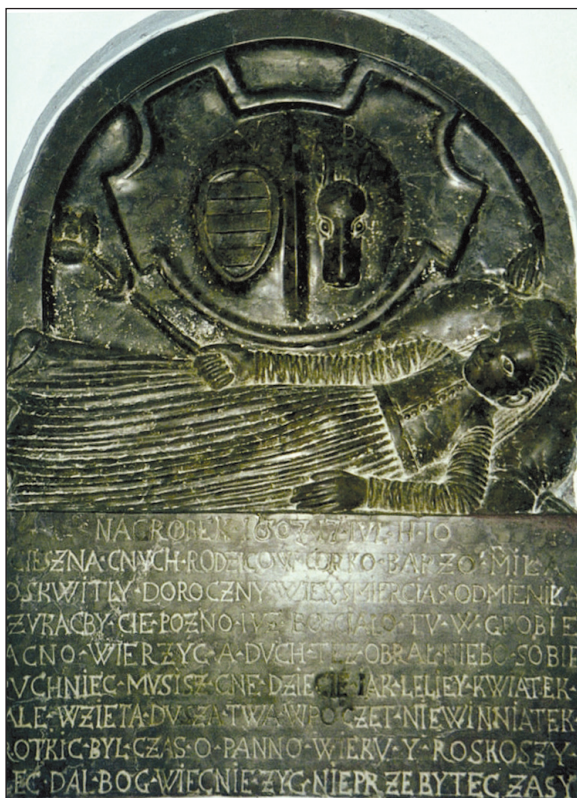
9. Płyta nagrobna w zakrystii kościoła parafialnego pw. św. Wawrzyńca w Sieciechowie, fot. K. Majcher

W zakrystii kościoła parafialnego pw. św. Wawrzyńca w Sieciechowie, który w 1502 r. został inkorporowany do miejscowego klasztoru, znajduje się kamienna płyta nagrobna z wyrytym epitafium. W jej górnej części umieszczono herby rodzinne zmarłej dziewczynki — Korczak i Półkozic. Poniżej znalazł się wizerunek rzeźbiarski jej postaci oraz wierszowane epitafium z datą 1607 r., w którym rodzice żegnają zmarłą córkę (il. 9). Płyta została odnaleziona w 1991 r., podczas prac remontowych prowadzonych w kościele sieciechowskim 67 . Nadal bez odpowiedzi pozostają pytania, czyj to jest nagrobek oraz kto był jego fundatorem.