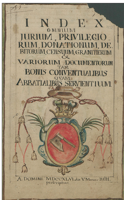
1. Strona tytułowa inwentarza z 1746 r. (BDS, Akta Zgromadzenia oo. Benedyktynów w Sieciechowie, sygn. R. 1930, k. 102)