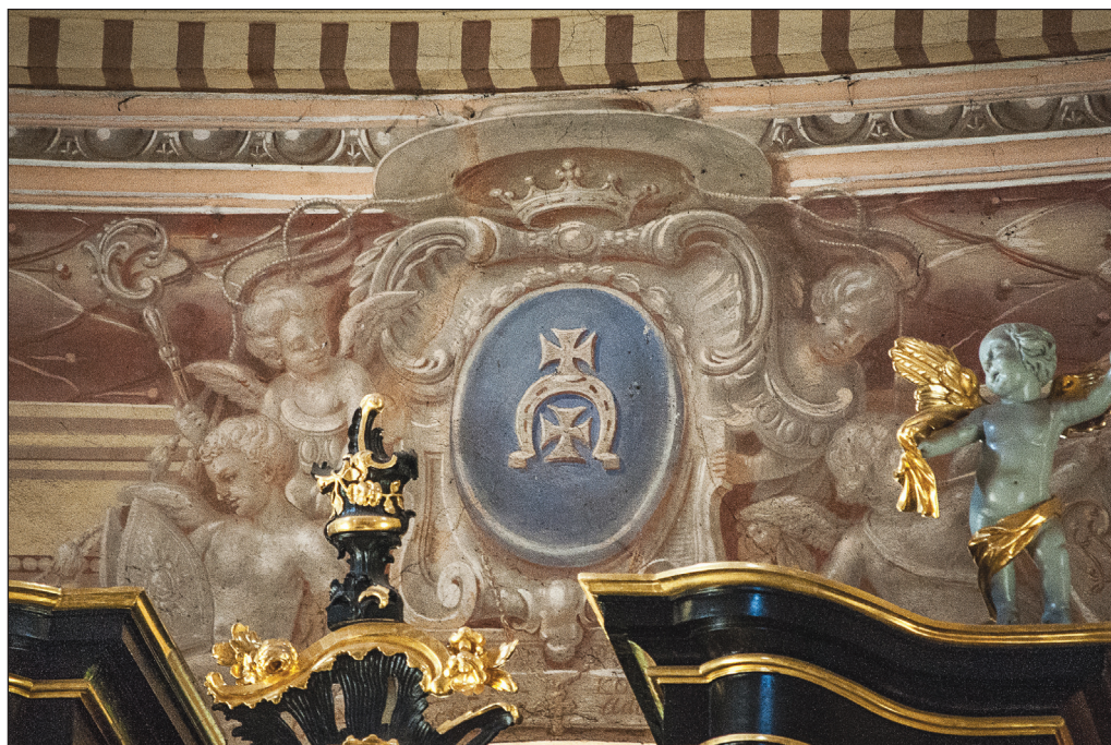
6. Herb Lubicz na polichromii kościoła parafialnego pw. Wniebowzięcia NMP w Opactwie