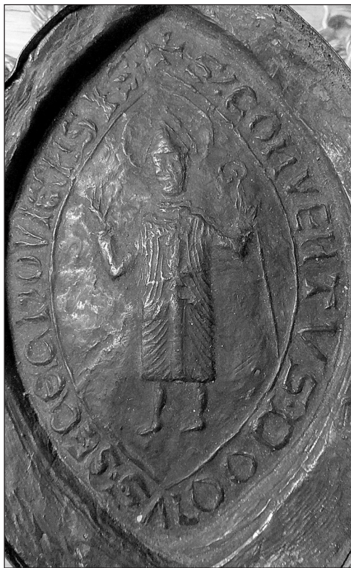
3. Pieczęć klasztoru sieciechowskiego z 1590 r., fot. R. Stępień (APPD, sygn. DokKr 406)