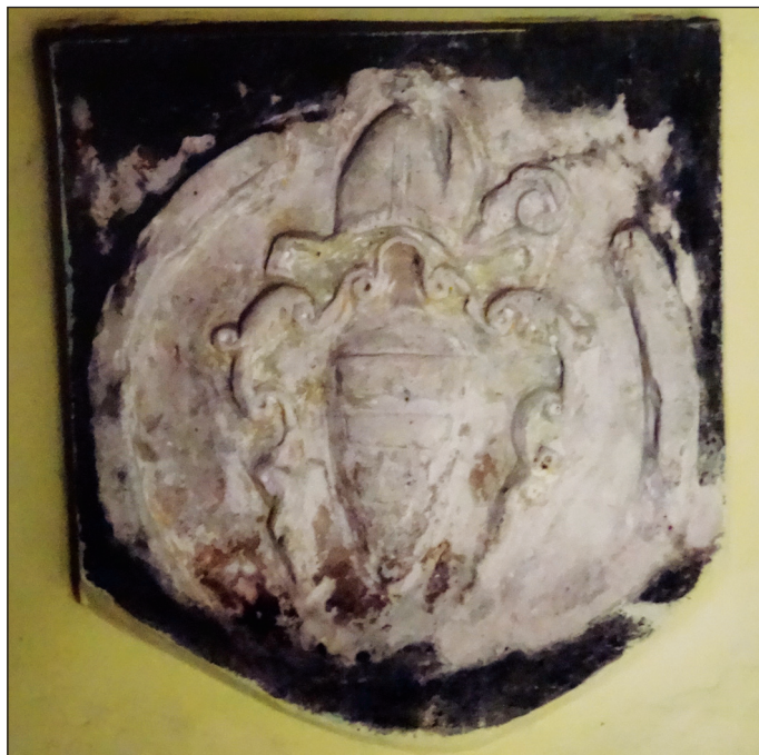
7. Tablica kamienna z herbem Korczak w sieni plebanii w Opactwie

który pełnił też posługę biskupa kamienieckiego (1607–1614) i arcybiskupa lwowskiego (1614–1633) 53 . Herbem Korczak pieczętował się też Józef Wereszczyński, opat sieciechowski (1581–1598) i biskup kijowski (1592–1598), a przy tym znakomity kaznodzieja i pisarz polityczny 54 . Jako przełożeni klasztoru obaj zapisali się bardzo korzystnie na kartach historii opactwa sieciechowskiego, dbając o rozwój duchowy i materialny miejscowego konwentu 55 .