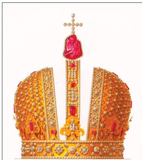
2. Korona Anny Iwanowny z 1730 r.

ale raczej nie „pruskiej”. Szczególnie reforma herbów miast i prowincji wprowadzała unifikację i elementy rangowe na wzór napoleoński 56 . Wskazuje na to system koron murowanych, wieńców i wstęg, a także wykorzystanie franc-quartier (kantonu) dla oznaczenia statusu miasta. Dodajmy statusu zależnego od siedziby władz administracyjnych. Trzeba jednak podkreślić, że te elementy (wykorzystanie kantonu, zewnętrzne elementy herbu jak wieńce, korony) oraz ogólnie stylistyka napoleońska zostały zapożyczone do heraldyki miejskiej wielu krajów. Z punktu widzenia polskiej tradycji Koehne przede wszystkim „usankcjonował biurokratyczne pojmowanie miasta i prowincji, nie jako indywiduum czy tym bardziej korporacji, ale jako elementu ustroju administracyjnego” 57 .