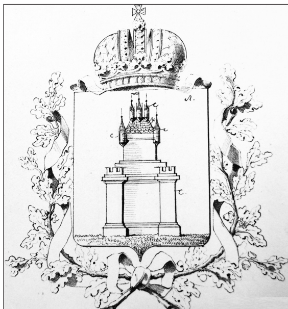
5. Herb guberni siedleckiej i niezatwierdzony projekt

dopuszczano do ich zatwierdzenia. Niżej przedstawimy dwa przykłady ilustrujące charakterystyczne tendencje w projektowaniu herbów miast Królestwa Polskiego.