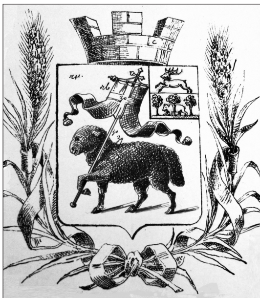
3. Projekt herbu Urzędowa, autorstwa B. Koehnego