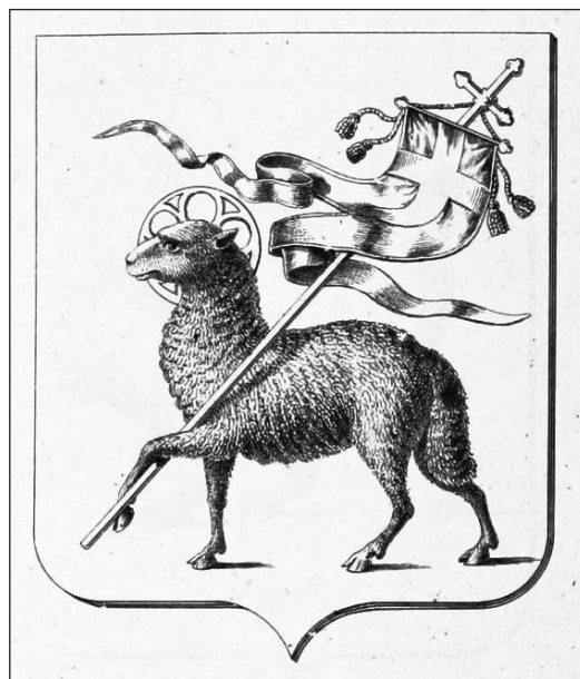
4. Herb bułgarski z herbu rosyjskich ziem północno-wschodnich (źródło: PSZRI II, t. 32, 1857, cz. 2, № 31 720)

rosyjskiej zgodnie z zasadami heraldyki europejskiej były bardzo szeroko zakrojone. Objęły też heraldykę szlachecką. Pomimo ostrych sporów naukowych, które zrażały do niego wiele autorytetów, został mianowany w 1868 r. radcą naukowym Ermitażu. Opracował znaczną część cennych zbiorów tej instytucji, zwłaszcza dotyczących monet starożytnych i niemieckiego średniowiecza. Opublikował pracę na temat starożytnej numizmatyki Pontu, Bosforu i Krymu 64 .