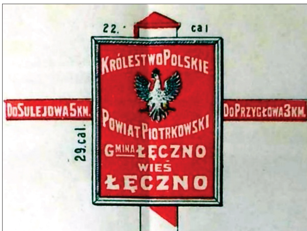
5. Wzór drogowej tablicy informacyjnej, 1917