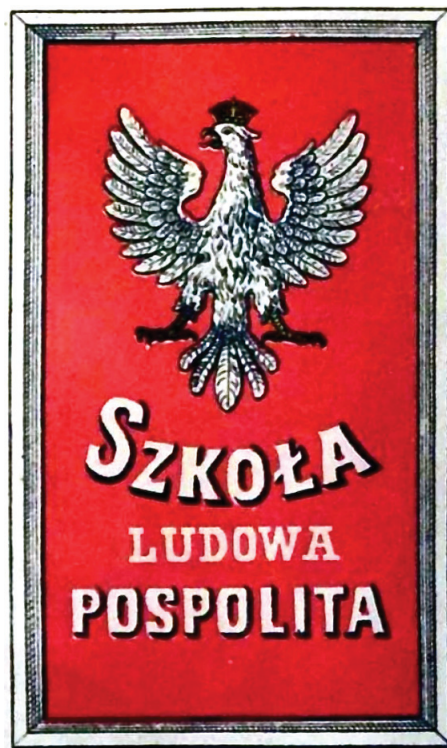
4. Wzór tablicy szkoły ludowej pospolitej, 1917