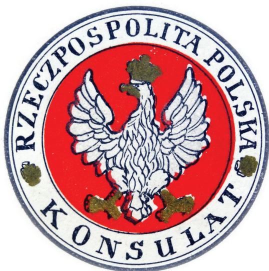
6. Wzór tablicy konsulatu Rzeczypospolitej Polskiej, 1919–1927