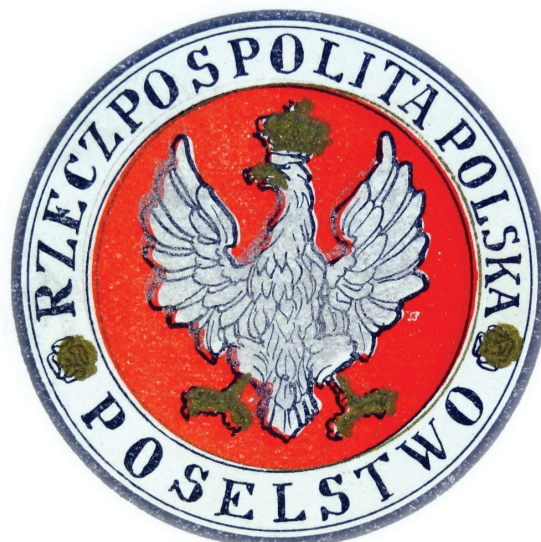
7. Wzór tablicy poselstwa Rzeczypospolitej Polskiej, 1919–1927

w sprawie urzędowych oznak dobrze wpisują się w ogólny wysiłek II Rzeczypospolitej podjęty po sierpniu 1919 r. w celu uporządkowania wszystkich sfer szeroko rozumianej urzędowej symboliki państwowej i samorządowej. W przypadku urzędowych tablic sprawę dodatkowo komplikowały zaborowe regionalizmy wynikające z różnych sposobów definiowania i identyfikowania władz i urzędów państwowych należących do zaborców, które przejęte zostały po listopadzie 1918 r. przez Polaków.