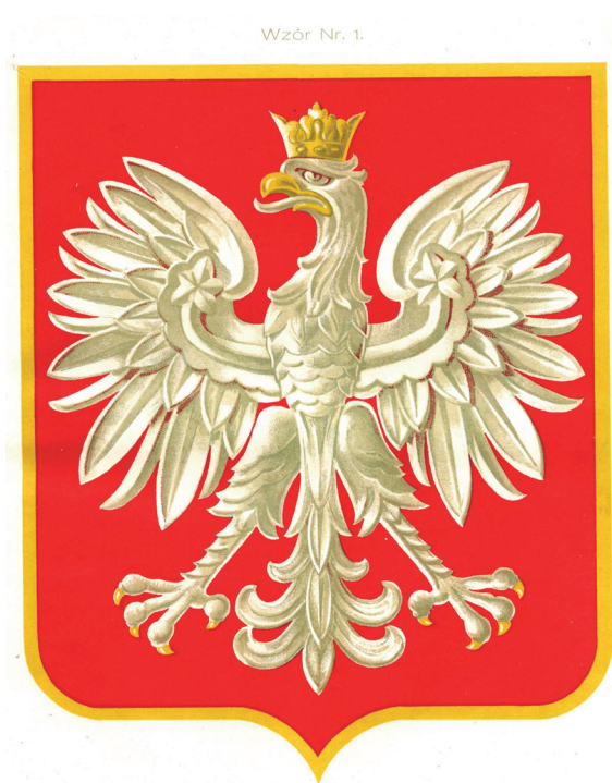
8. Herb Rzeczypospolitej według wzoru nr 1 do rozporządzenia Prezydenta Rzeczypospolitej z 13 grudnia 1927 r.