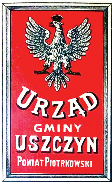
3. Wzór urzędowej tablicy dla urzędu gminy, 1917