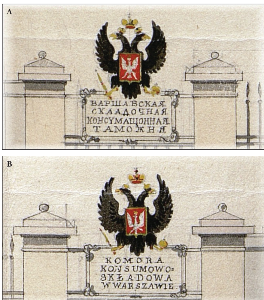
2. Tablice z godłem rosyjsko-polskim i nazwami (nazwiskami) urzędu w językach rosyjskim i polskim, 1842