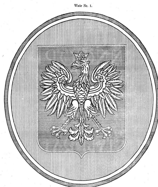
9. Owalna tablica z herbem II Rzeczypospolitej według wzoru 1 do rozporządzenia Prezydenta Rzeczypospolitej z 29 marca 1930 r.

wet urzędowej propozycji korekty znaku, został utrzymany w niezmienionej postaci do września 1939 r., a nawet został przekazany powojennym pokoleniom i jest obecnie, po drobnych korektach, godłem III Rzeczypospolitej. Orzeł o cechach piastowsko-jagiellońsko-batoriańskich 16 i o mocarstwowej formie podobał się rządzącym Polską po maju 1926 r. i w związku z tym mógł zostać wprowadzony do nowego prawa pomimo protestów motywowanych politycznie i merytorycznie.