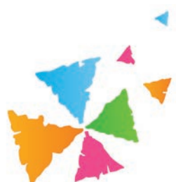
4. Logo miasta Rzeszowa — „Kultura w Rzeszowie”, wersja podstawowa (< http://www.rzeszow.pl/kultura-i-sport/logo-kultura-w-rzeszowie >)