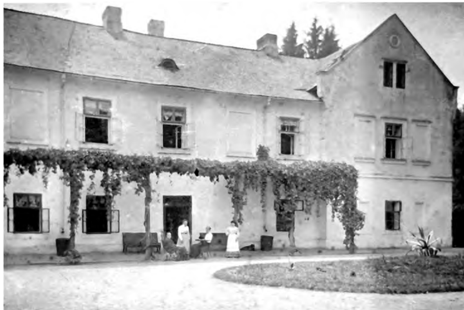
Dwór w Domażyrze