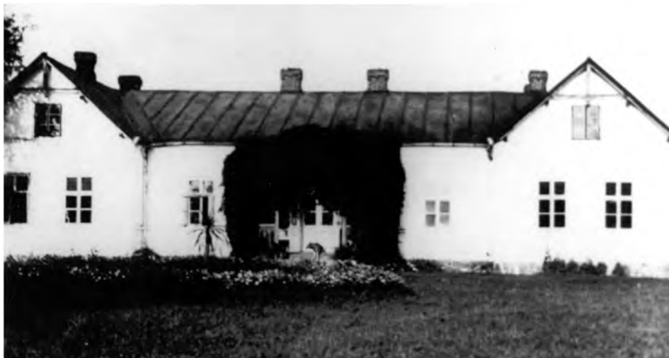
Dwór w Nagórkach