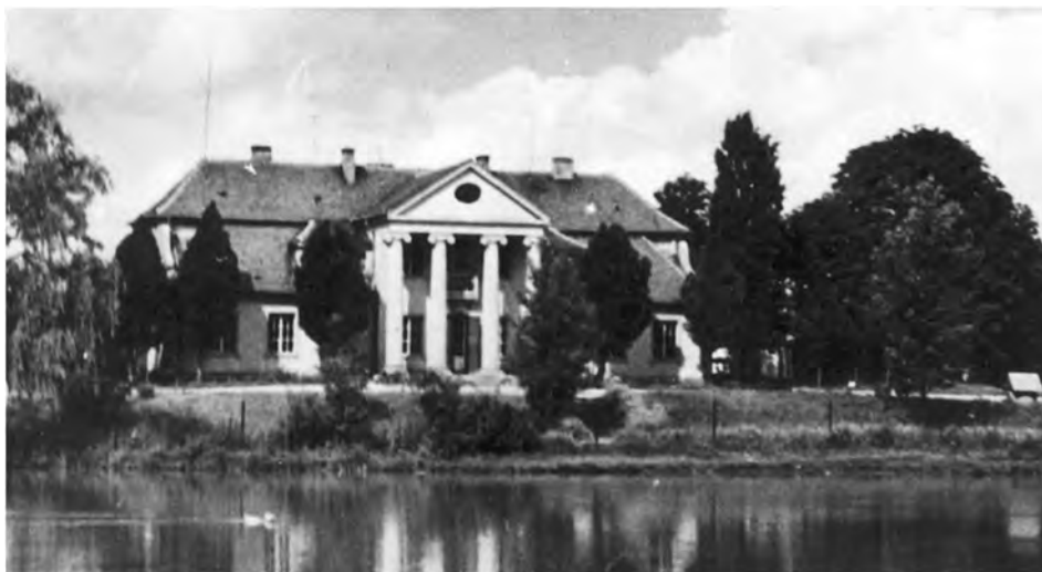
Dwór w Bedlnie

J. S. wybudował w Bedlnie budynki gospodarcze o wysokim standardzie. Przeprowadził tam meliorację i elektryfikację. Postawił nowy stylowy dwór, rozbudowując starą siedzibę. Założył park, projektowany przez inż. Kisielewskiego z Poznania. Wzniósł kilka budynków mieszkalnych dla służby oraz 7-klasową szkołę dla dzieci z Bedlna i okolic. Zorganizował Ochotniczą Straż Pożarną i tow. Sokół. W majątku prowadzono gospodarstwo pszenno-buraczane, uprawiano duże ilości rzepaku i maku dla olejarni, ziemniaki przemysłowe, żyto, jęczmień i owies dla potrzeb własnych. Buraki cukrowe dostarczano do cukrowni Dobrzelin, której J. S. był udziałowcem.