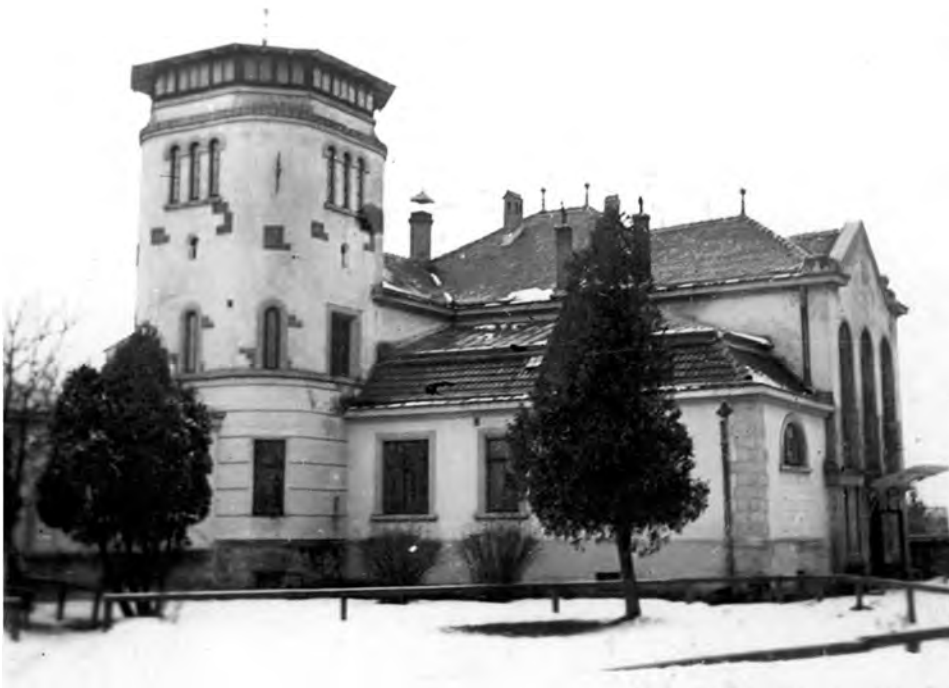
Dwór w Kopalinach