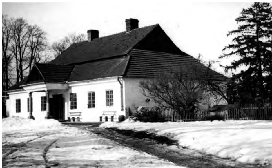
Dwór w Libertowie