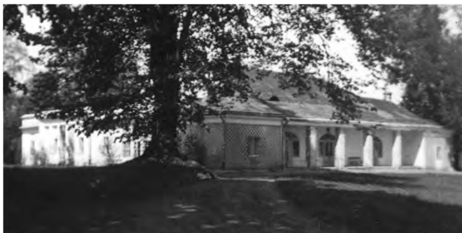
Dwór w Hawłowicach Górnych