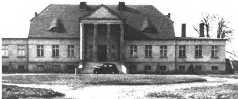
Dwór w Gninie