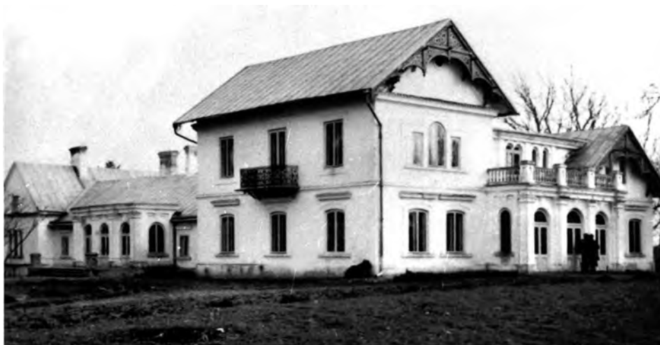
Dwór w Stróży