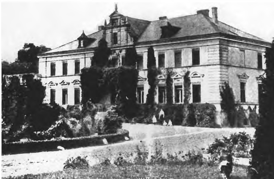
Dwór w Niegolewie