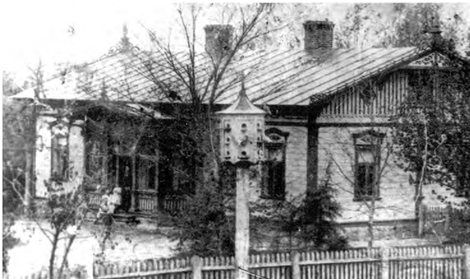
Dwór w Liberadzu, stan przed 1939

Zmarł tragicznie w wyniku wypadku samochodowego w Chojnowie. Pochowany w grobowcu rodzinnym w Dąbrowie w pow. mławskim.