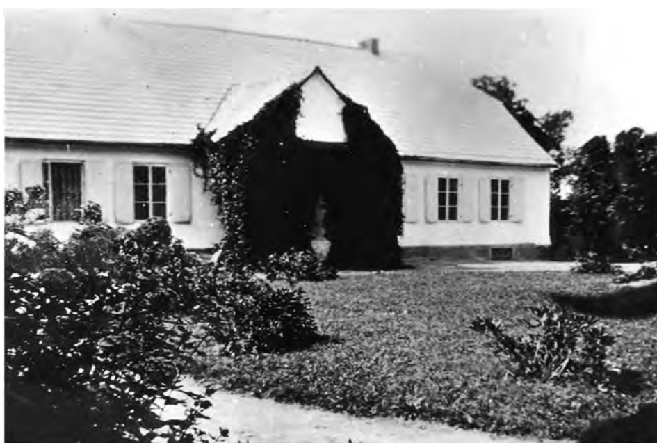
Dwór w Mazowszanach

W lipcu 1945 wyjechał na Dolny Śląsk, gdzie podjął pracę we wrocławskim Wojewódzkim Urzędzie Ziemskim z siedzibą w Legnicy, a następnie w Cieplicach pod Jelenią Górą, dokąd w sierpniu sprowadził rodzinę. Wkrótce został skierowany do pracy w organizowanym Zarządzie Okręgowym PNZ, przekształconym później w PGR. W 1948 przeniósł się wraz z zakładem pracy do Legnicy.