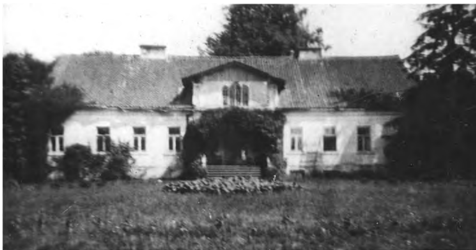
Dwór w Setropiu