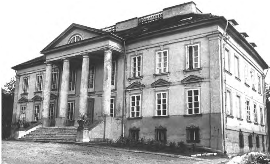
Pałac w Lubrańcu