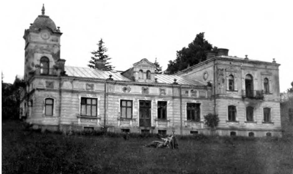
Dwór w Mikstał, 1937

F. R., dobry rolnik, w zarządzaniu majątkiem wyróżniał się energią, bystrością i pracowitością. Był silną indywidualnością i starał się kierować życiem dzieci w duchu patriotyzmu i przywiązania do ziemi rodzinnej.