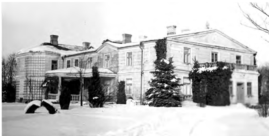
Dwór w Głogowej

ne, a także dokarmiane i ubierane. W czasie okupacji w Warszawie Z. K. pracowała społecznie. Zanosila obiady do szpitala Ujazdowskiego, gdzie przebywali polscy ranni żołnierze, dokarmiała uczącą się ubogą młodzież. Wysyłała paczki żywnościowe do oflagów.