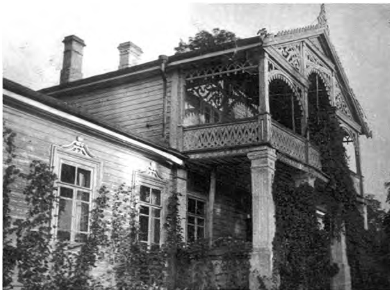
Dwór w Wojtkiewiczach