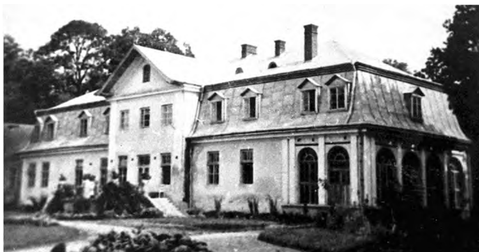
Dwór w Perespie