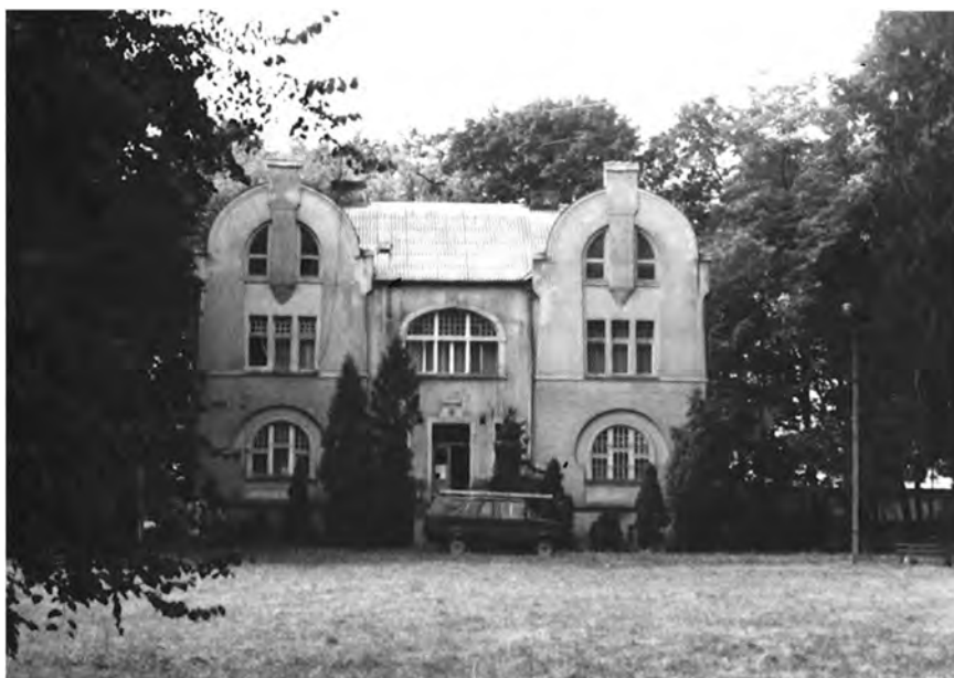
Dwór w Doruchowie, stan obecny

cegielnię i młyn turbinowy. Kilka lat później kupił cegielnię w Ostrzeszowie oraz udział w kaflarni „Nier i Ska” w Ostrzeszowie. Powyższe zakłady przynosiły dochody, umożliwiające przetrwanie trudnych okresów w rolnictwie, oraz dawały zatrudnienie łącznie ok. 80 pracownikom. S. T. był współorganizatorem dużej wystawy przemysłowej w Ostrzeszowie w 1929. Aktywny społecznie był prezesem Związku Powstańców i Wojaków, Kółek Rolniczych, Mleczarni Spółdzielczej w Kępnie. Działał w radach nadzorczych Polskiej Spółki Nasiennej w Poznaniu, Zjednoczonych Cukrowni Witaszyce–Zduny. Był radcą Poznańskiego Ziemstwa Kredytowego w Poznaniu.