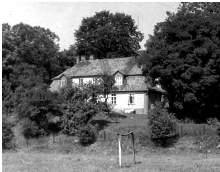
Dwór w Janowickach