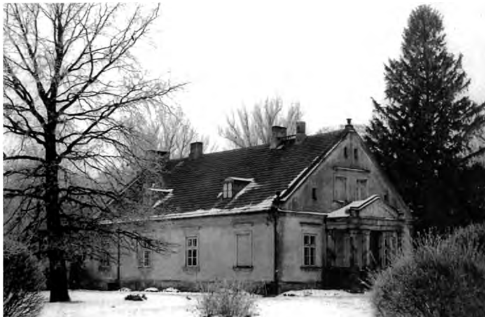
Dwór w Miechowicach

dobrze zagospodarowany, o ziemi pszenno–buraczanej, z budynkami murowanymi w dobrym stanie. K. B., mimo że już niemłody, 2 razy w tygodniu jeździł do Wagańca oddalonego od Jądrowic o 22 km, dozorując pracujących tam rządców.