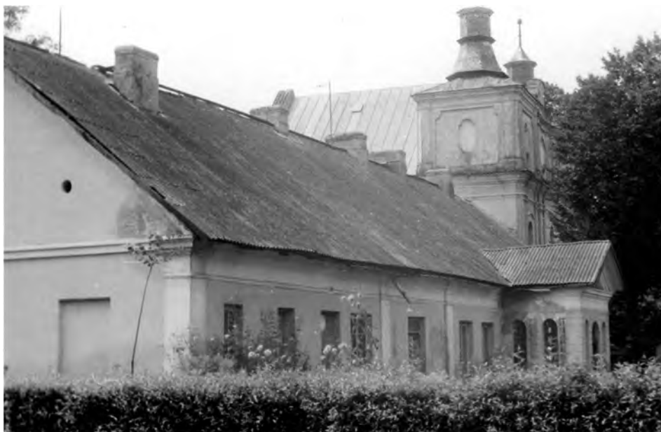
Dwór w Jeleńcu

W 1919 obaj bracia wstąpili jako ochotnicy do WP. Antoni w walkach z Ukraińcami został ciężko ranny w nogę, co spowodowało trwałe kalectwo. J. D. zachorował na tyfus plamisty, leżał w chacie na Polesiu. Wyleczenie bez pomocy lekarskiej zawdzięczał troskliwej opiece miejscowej rodziny żydowskiej. Po wyzdrowieniu w 1920 przeszedł do rezerwy w stopniu ppor. Co roku był wzywany na ćwiczenia do 24 p.uł. w Kraśniku.