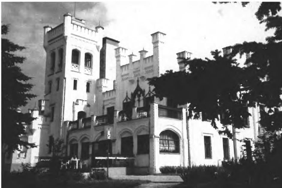
Pałac w Psarskiem