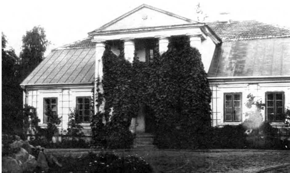
Dwór w Płomianach