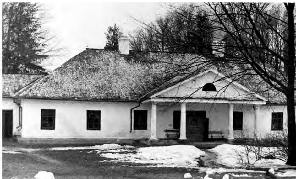
Dwór w Kotiurzyńcach