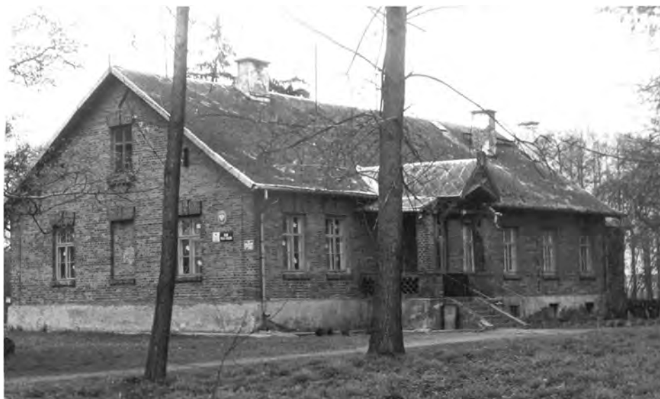
Dwór w Bogdanach