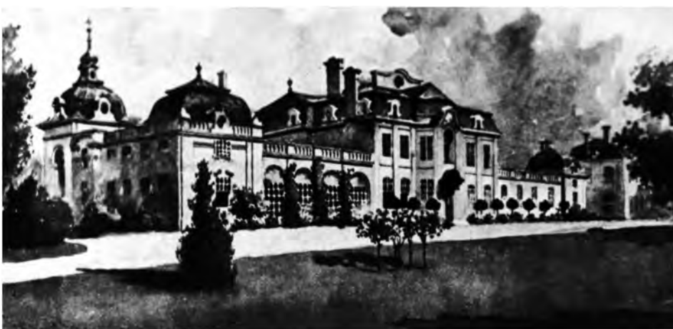
Pałac w Okocimiu

Podobnie jak ojciec należał do Stronnictwa Prawicy Narodowej (SPN). Ponieważ SPN współpracowało z BBWR w 1935 kandydował do Sejmu IV kadencji, z okręgu wyborczego: Brzesko (okręg wyborczy nr 83), był posłem na sejm 1935–1938, wybrany głównie chłopskimi głosami. W Sejmie był sekretarzem Komisji Spraw Zagranicznych.