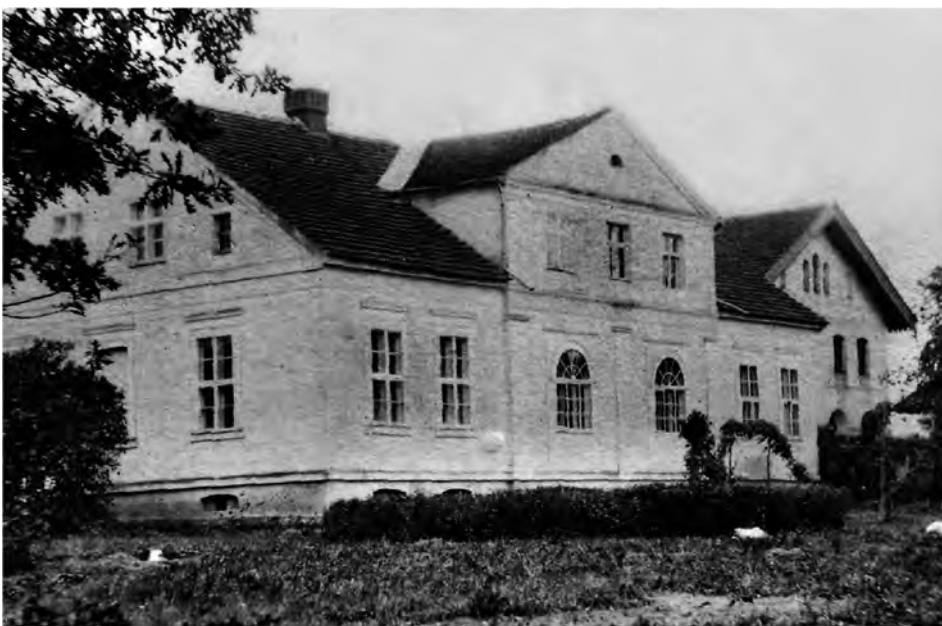
Pałac w Sędzicach (fot. z 1930)