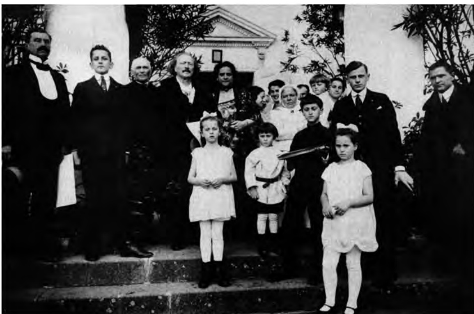
Ignacy Paderewski w Śmielowie

wanie majątkiem UP w Gołędzinie, pracując jednocześnie naukowo w Zakładzie Uprawy Rolnym Roślin UP. Wydał wiele prac naukowych, a także publikował popularne artykuły w gazetach rolniczych, był również redaktorem „Pogadanek dla rolników” w poznańskiej rozgłośni Polskiego Radia.