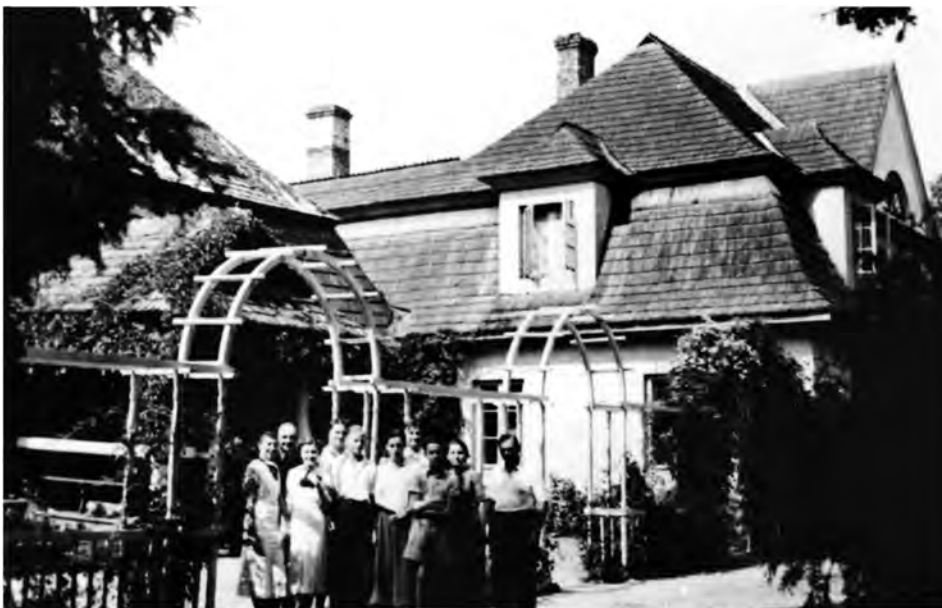
Dwór w Żochach Wielkich