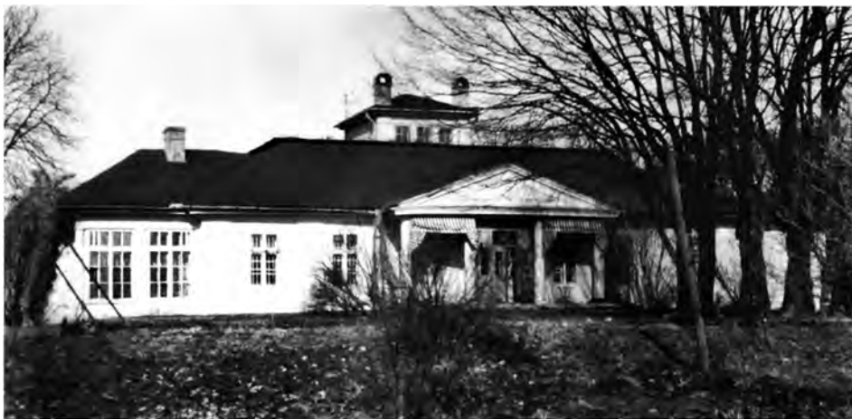
Dwór w Olszy