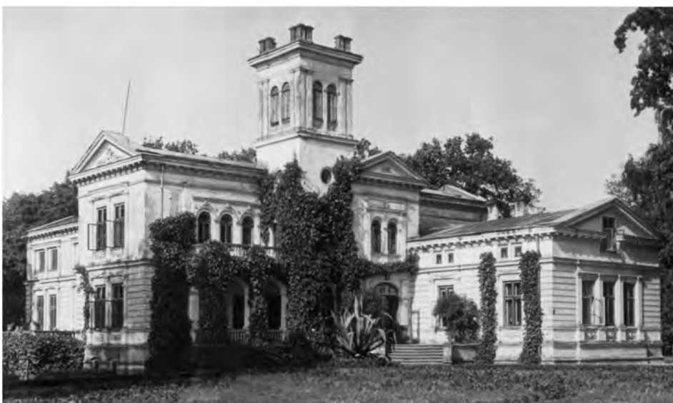
Pałac w Łoniowie

wie. W klasie drugiej i trzeciej miał bardzo dobre wyniki nauczania, już w klasie czwartej z matematyki był „bardzo mierny” i dlatego też od piątej klasy rozpoczął naukę w III Gimn. im. Jana III Sobieskiego w Krakowie. Egzamin dojrzałości zdał z odznaczeniem w 1891. Po maturze odbył jednoroczną służbę wojskową w p. ul. w Przemysłu. Po powrocie z wojska studiował przez rok prawo na uniwersytecie w Berlinie, a później przez trzy lata na Uniwersytecie w Jassach. Doktoryzował się w 1897. Po studiach pracował w namiestnictwie we Lwowie jako praktykant. Po dwuletniej pracy urzędniczej w 1900 złożył rezygnację i powrócił do Łoniowa. Choć nie studiował rolnictwa, gdy osiadł na roli i objął zarząd majątku, doszedł do wysokiego znawstwa problematyki rolniczej. Opublikował wiele artykułów o tematyce politycznej na łamach „Przeglądu Katolickiego”, „Myśli Katolickiej” i „Słowa”. Posyłał również artykuły z dziedziny gospodarki rolnej do redakcji „Hodowcy” i „Rolnika”. Interesował się jeździectwem, sam wielokrotnie brał udział w wyścigach. Hodowli wyścigowych koni poświęcał cały swój wolny czas. Rasy, pochodzenie i krzyżowanie koni były jego życiową pasją. Z wielu hodowcami nawiązał obszerną korespondencję, a także ogłaszał swoje porady w „Jeźdźcu i Myśliwym”. Z jego inicjatywy powstało gminne tow. kredytowe, wyodrębnione z kółka rolniczego łoniowskiego.