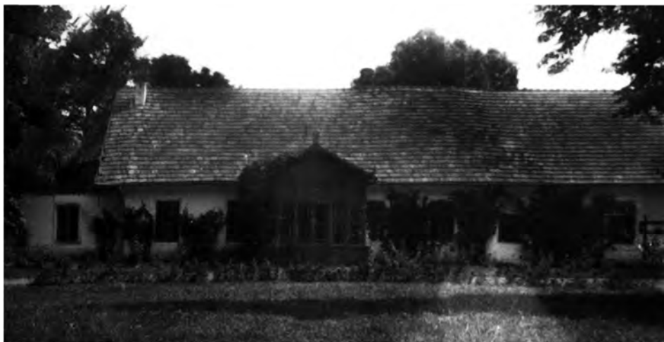
Dwór w Jankowicach