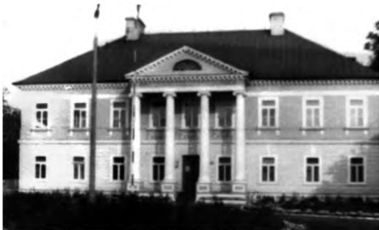
Pałac w Gostkowie

Rolniczą w Warszawie, została aresztowana razem z mężem 14.04.1940 i do 13.06.1940 więziona w Łęczycy, następnie wraz z teściową i dziećmi przybywała w obozie w Łodzi, a w końcu lipca deportowano do GG. Parę miesięcy spędziła na Lubelszczyźnie, a później przeniosła się z rodziną do Krakowa, gdzie pracowała w biurze niemieckim i dorabiała nielegalnym handlem.