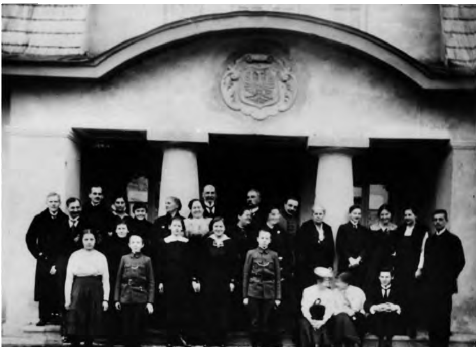
Zjazd rodziny Choromańskich w Żochach Wielkich