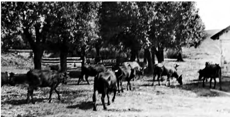
Hodowla bydła czerwono-polskiego w Starej Wsi (lata 20. XX w.)