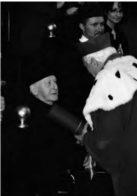
Andrzej Ciechanowiecki otrzymujący doktorat honoris causa na Uniwersytecie Jagiellońskim (2009)