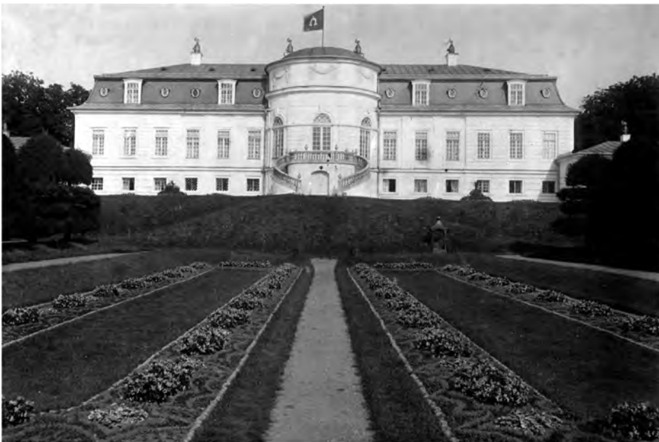
Pałac w Boczekowie od strony ogrodu