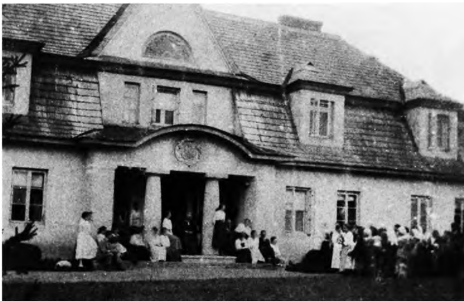
Dwór w Żochach Wielkich od podjazdu

J. Ch. w 1887 ukończył Wydział Agronomiczny w Inst. Gospodarstwa Wiejskiego i Leśnictwa w Puławach. Po ojcu objął maj. Żochy (620 ha), zakupiony przez jego dziadka. Zarządzał majątkiem jednocześnie pracując aktywnie społecznie w różnych organizacjach oraz instytucjach gospodarczych i społecznych. Był m.in. członkiem Komitetu CTR w Warszawie, członkiem założycielem (1907) i prezesem Okręgowe-