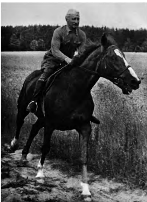
Zdzisław Karski na koniu