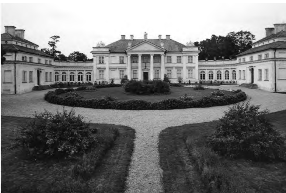
Pałac w Śmielowie