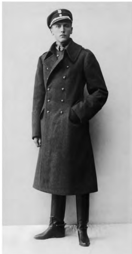
Andrzej Osiecimski–Czapski (1919–1921)