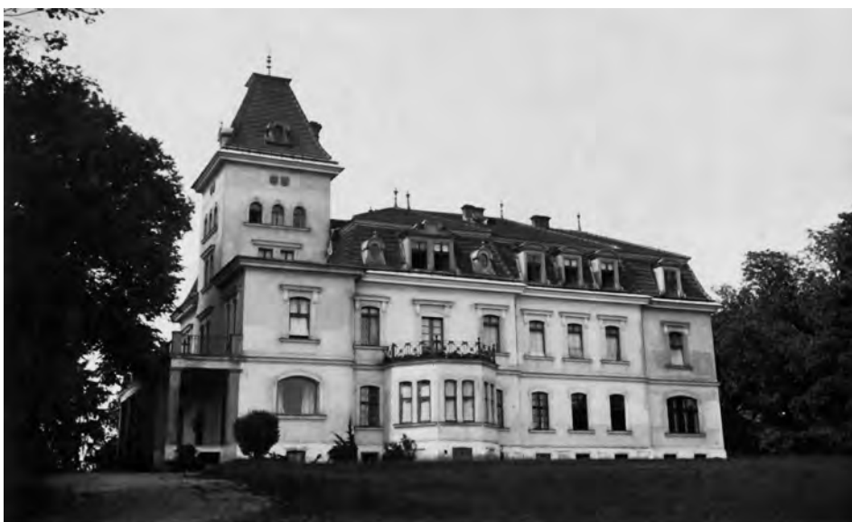
Pleszów k. Krakowa (l. 30. XX. w.)