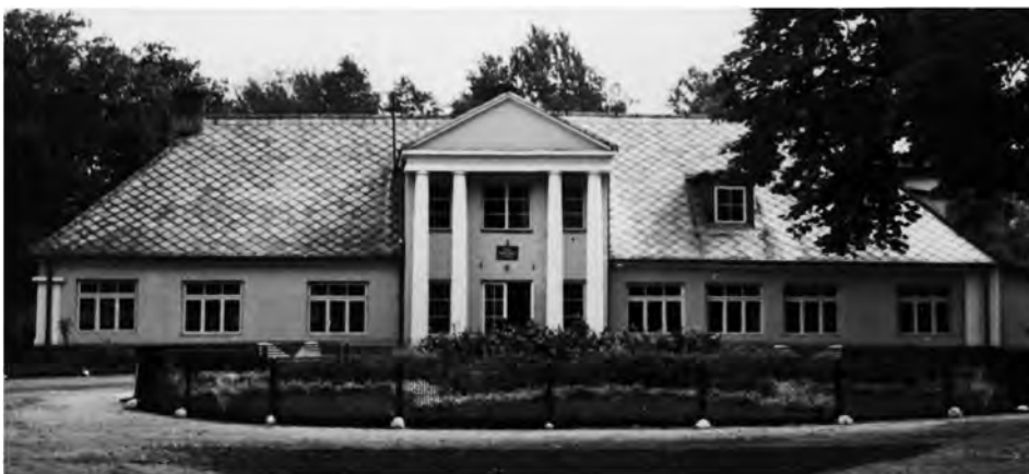
Dwór w Dańkowie

Swoje doświadczenia w dziedzinie nasiennictwa opisał w pracy: Zasada równoległości przy ocenie wyników doświadczeń zbiorowych (W. 1895). Opublikował również, m.in. Culture de plantes agricoles améliorées à Dankow Gouv. de Varsovie. Rapport abrégé des procédés de culture d'Alexandre Janasz préparé spécialement pour l'Exposition Universelle de Paris 1900 (W. 1900); Wyniki doświadczeń przeprowadzonych w Dańkowie z różnymi odmianami ziemniaków w latach 1900, 1899 i 1898 (W. 1901).