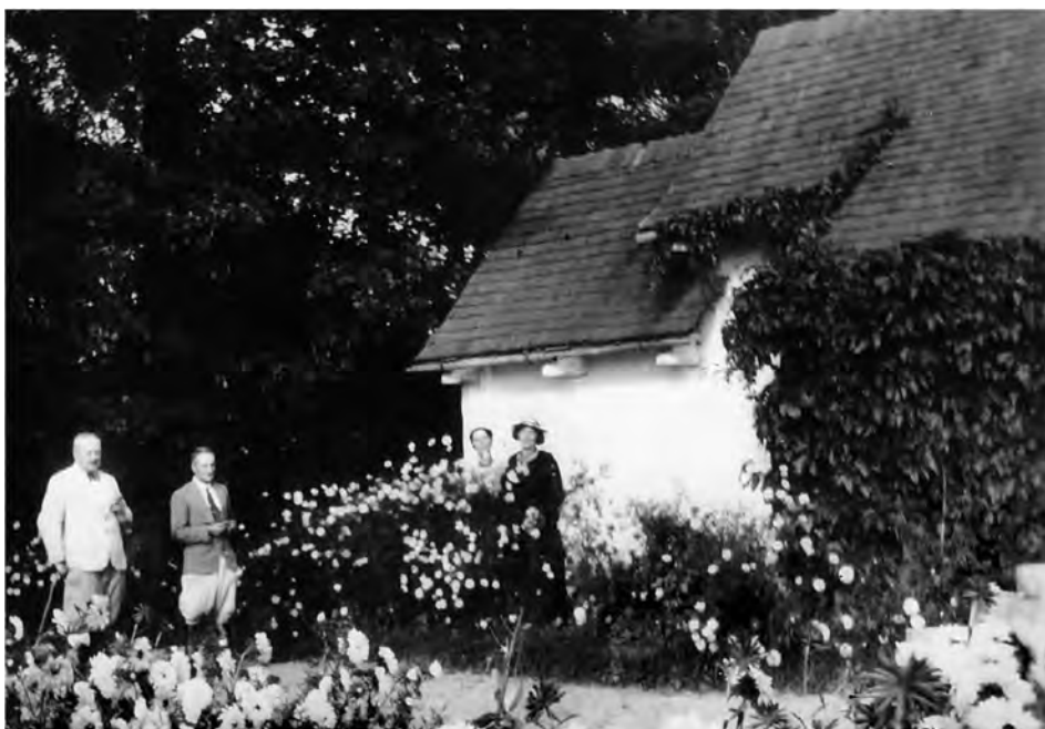
Dwór w Horyszowie Ruskim