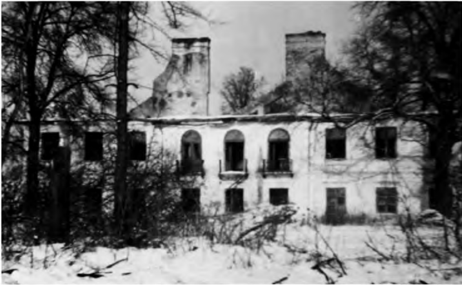
Ruiny pałacu w Kumelsku