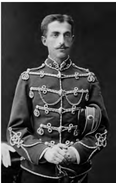
Władysław Ciecchanowiecki (1882)