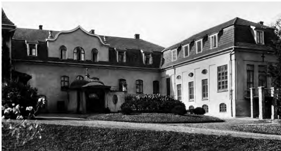
Pałac Czartoryskich w Pełkiniach