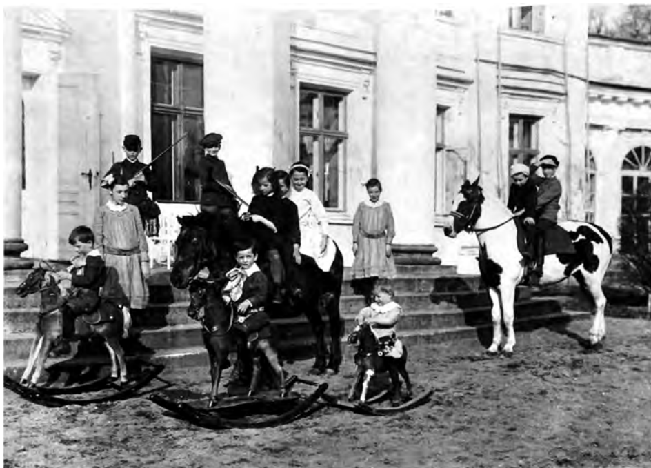
Dzieci w Śmielowie na koniach