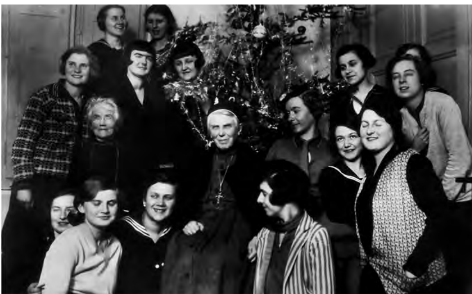
Panny Dąmbskie ze św. Urszulą Ledóchowską (1865–1939) (fot. z 1929)