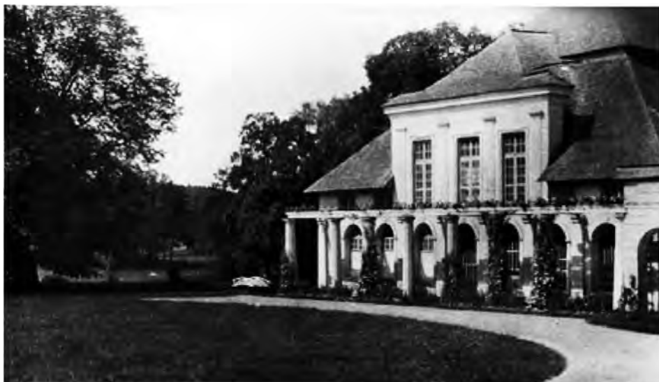
Dwór w Krasnobrodzie

torium dla dzieci z Warszawy. Miejscową ludność zachęcił do uprawy tytoniu, co na ubogich ziemiach zwiększyło ich dochody. Wystarał się o przeprowadzenie drogi bitej z Zamościa do Krasnobrodu. Uprzemysłowienie majątku umożliwiła budowa w czasie wojny przez Austriaków linii kolejowej przez tereny majątku. Powstała możliwość wywożenia produktów rolnych i leśnych na sprzedaż. Trzeba jednak pamiętać, że cała praca nad ulepszeniem gospodarki Krasnobrodu odbywała się w warunkach kryzysu gospodarczego i walki z nieuchronnym zadłużeniem majątku.