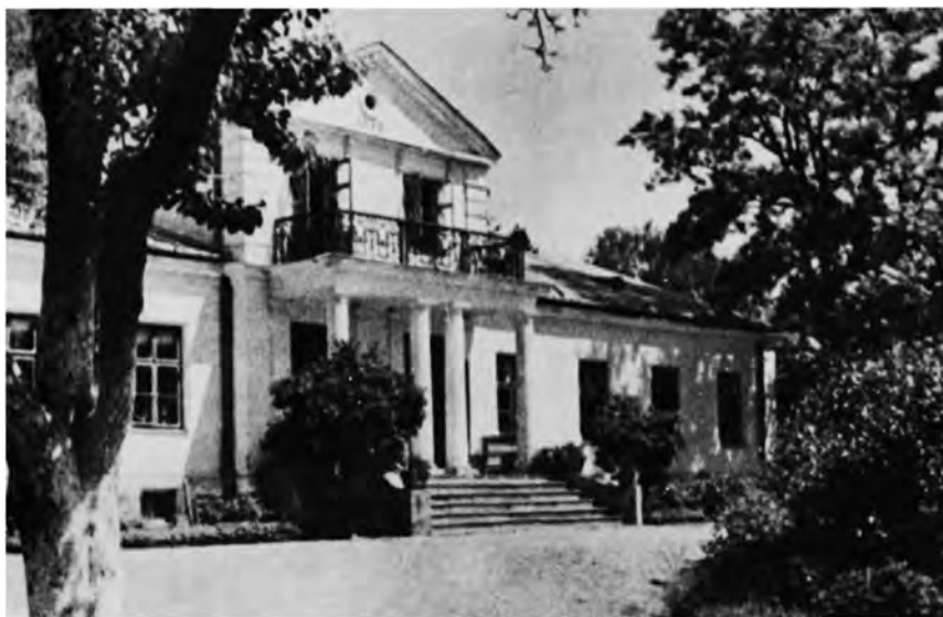
Dwór w Boguszycach