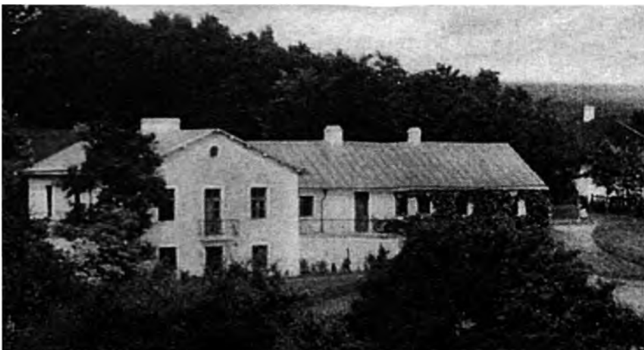
Dwór w Baranówce

dypłomami i medalami (w tym 3 medalami złotymi i 13 srebrnymi). Pierwszy medal (srebrny) otrzymał „Siew” na wystawie w Kamieńcu Podolskim w 1902 od Mińskiego Tow. Rolniczego. Przez 18 lat prowadził również kopalnię fosforytów, z wykorzystaniem nowej metody eksploatacji — szybami pionowymi. Za to rozwiązanie otrzymał złoty medal.