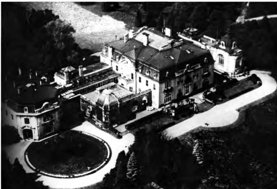
Pałac w Okocimiu

Nart rozparcelowano jedynie ok. 100 ha użytków rolnych. Po parcelacjach J. G. O. zreorganizował klucz Skowierzyn, powstały folwarki: Zaleszany z siedzibą dyrekcji klucza (563,5 ha), Podsadzie (123,2 ha), Dzierdziówka (193 ha) wraz z młynem i cegielnią, oraz rewiry leśne Podzamcze (1496,4 ha) i Chwałowice (842 ha). Od maj. Nart Nowy odłączył J. G. O. część lasów przyłączając je do rewiru leśnego Kamień–Morgi. W 1898 J. G. O. wybudował w Okocimiu rezydencję w stylu neobarokowym dla siebie i rodziny, zwaną potem nowym domem. Wokół pałacu rozplanowano 60 ha parku.